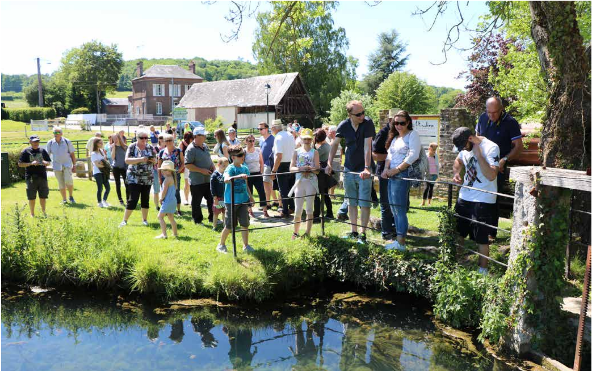
Besichtigung der Quelle des „Valorbiquet“, der Fluss an dem die 5 in Valorbiquet eingemeindeten Dörfer liegen