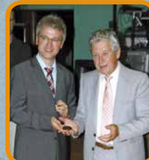
Ehemaliger Bürgermeister Roger Fistolet